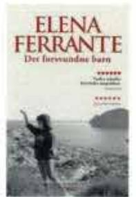
Det forsvundne barn, sidste del af muslread-romanerien af Elena Ferrante, C & K Forlag, 100 kr.