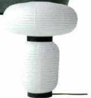
'Formakami', bordlampe, & tradition, endnu ikke prissat