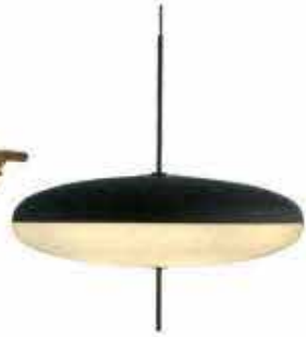
'Model 2065', pendel, Astep, 8.140 kr.