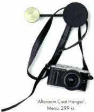
'Afteroom Coat Hanger', Menu, 299 kr.