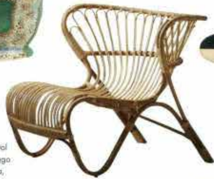
'Fox', rattan-stol designet af Viggo Boesen, Silka, 4.295 kr.