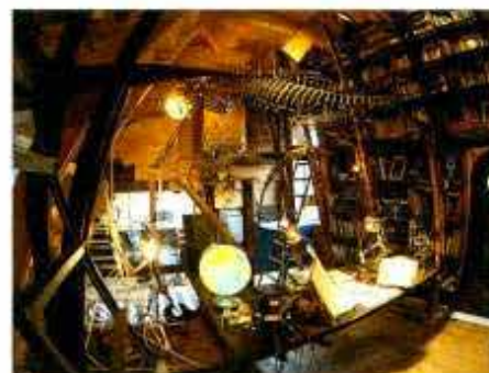
Allkonstverket AtelierForte museum.

Öppet tisdag till lördag 10-17, boka biljett för 10 euro på www.atelierforte.com/blog/museum/ Via Corelli 34 (buss 38, eller promenada från Lambrate)