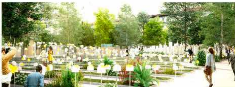
Interni undersöker framtidens boende. Nedan: Triennalen.