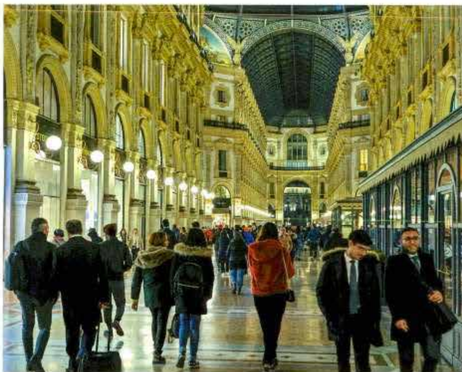
Designturister fyller på garderoben i lyxshoppinggallerian Vittorio Emanuele II.