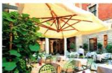
Le restaurant Il Salumaio di Montenapoleone le Garage Italia et l'hôtel Mandarin Oriental.