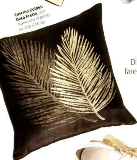
Cuscino Golden Deco Frette , con motivi oro ricamati su seta (250 €).