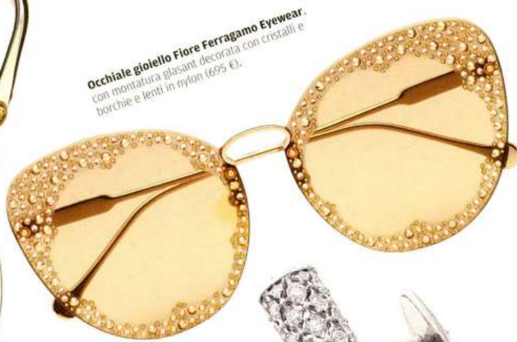
Occhiale gioiello Fiore Ferragamo Eyewear , con montatura gasant decorata con cristalli e borchie e lenti in nylon (695 €).