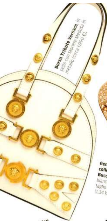
Borsa Tribute Versace , in pelle con Manete Medusa in metallo (circa 1.990 €).