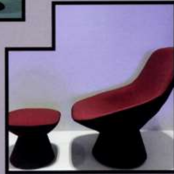
VENTURA CENTRALE Decode/Recode Design: Luca Nichetto och Ben Gorham för Salviati