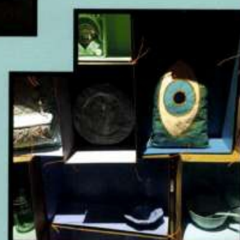
VENTURA CENTRALE Decode/Recode Design: Luca Nichetto och Ben Gorham för Salviati