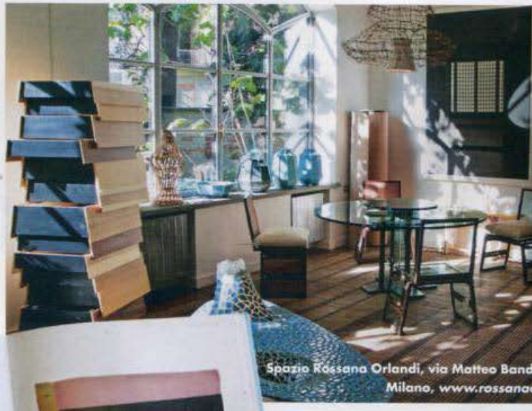
Spazio Rossana Orlandi, via Matteo Bandello 14/16, Milano, www.rossanaorlandi.com