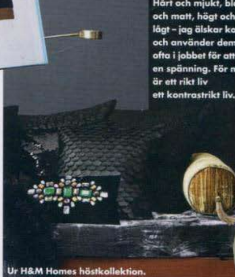
Ur H&M Homes höstkollektion.

Hårt och mjukt, blankt och matt, högt och lågt – jag älskar kontraster och använder dem ofta i jobbet för att skapa en spänning. För mig är ett rikt liv ett kontrastrikt liv.