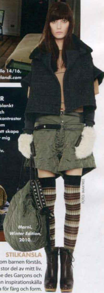
Marni, Winter Edition, 2010.